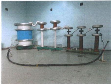
A2: 样品交流耐压试验